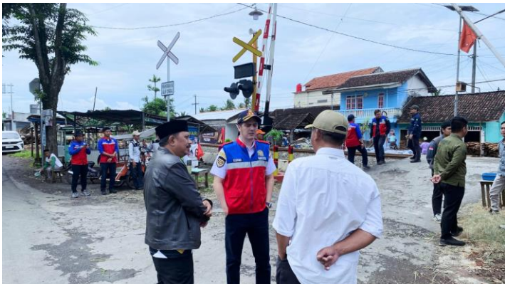
Menghadiri Peresmian Jalur Perlintasan (JPL ) Kereta api di desa Kaliboto lor. diresmikan oleh Kementrian Perhubungan RI.