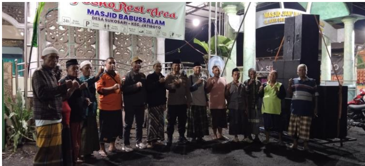
Pemantauan Posko Arus Mudik 2025 di Desa Sukosari