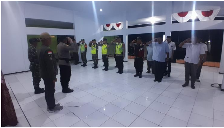
Apel Pengamanan Malam Idul Fitri Tahun 2025