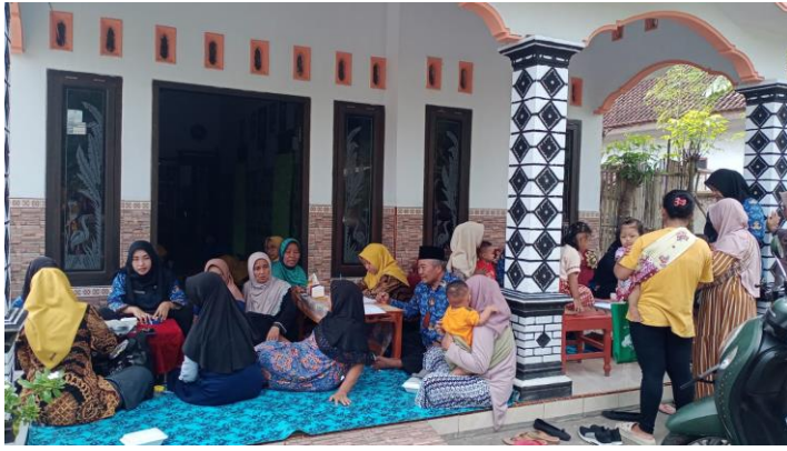
Posyandu Integrasi Layanan Layanan Primer (Ilp) Di Desa Banyuputih Kidul