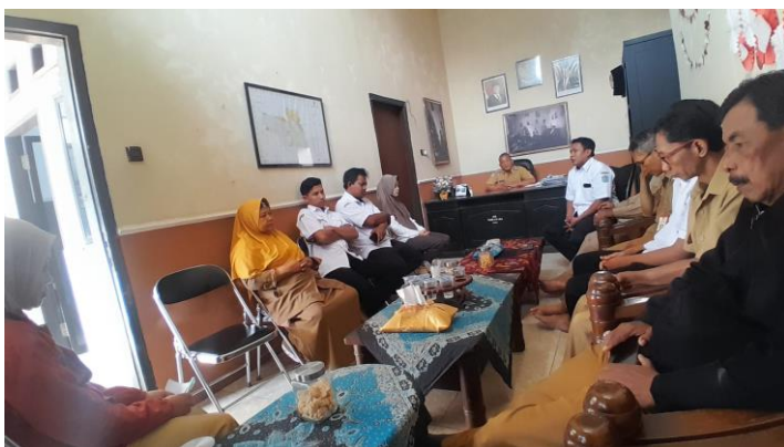
Rapat Staf Kecamatan Jatiroto