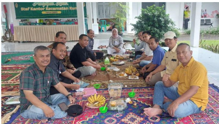
Anjang sana Camat