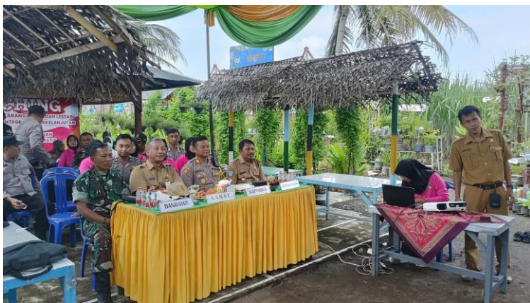
Launching program PEKARANGAN PANGAN LESTARI bersama Pak Kapolsek dan Danramil di Desa Kaliboto Lor