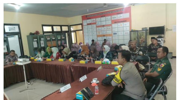
Lokmin Lintas Sektor TW II