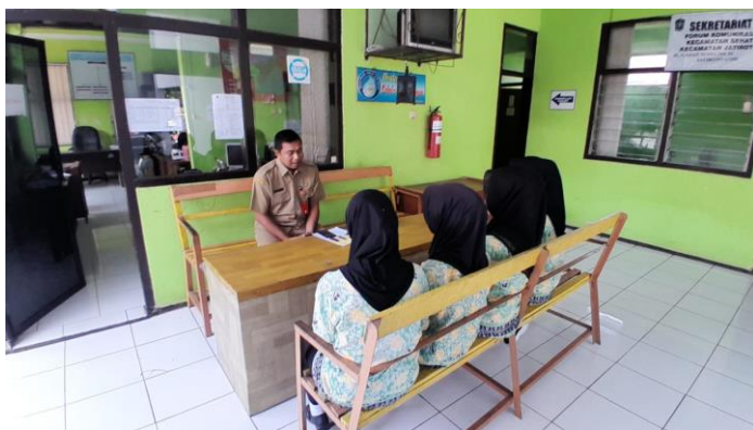
Penerimaan Siswa PKL dari SMK NEGERI 6 JEMBER