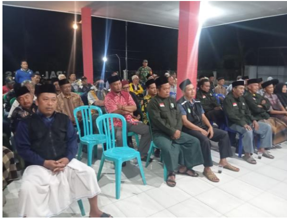
Pembinaan Satgas dan Linmas di Desa Jatiroto