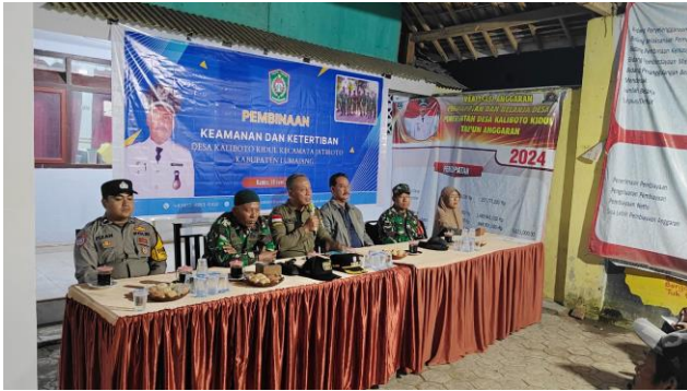
Pembinaan Satgas dan Linmas di Desa Kaliboto Kidul