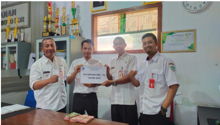
Pelunasan PBB Desa Kaliboto Lor