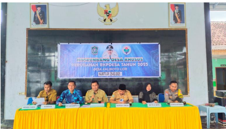
Musdesus perubahan RKP 2025 Desa Kaliboto Lor