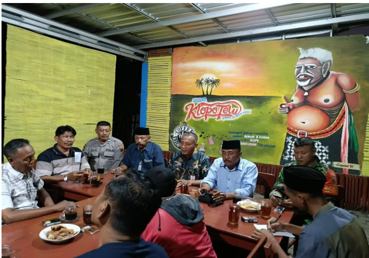
Koordinasi terkait penanganan banjir di Daerah Persil Jatiroto bersama forkopimcam dan warga sekitar