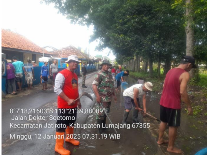
Kerja Bakti Masal Terkait Penanganan Banjir di Wilayah Kecamatan Jatiroto