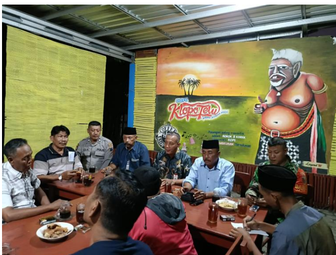
Koordinasi Terkait Penanganan Banjir Di Wilayah Kecamatan Jatiroto