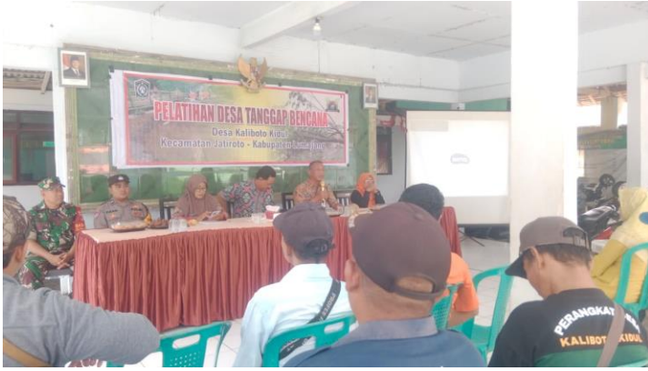
Pelatihan Desa Tanggap Bencana Di Desa Kaliboto Kidul