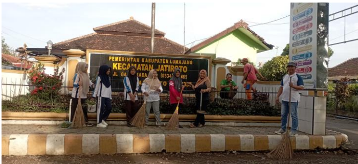
Kerja Bakti Bersama Dalam Rangka Memperingati Hari Sampah Nasional