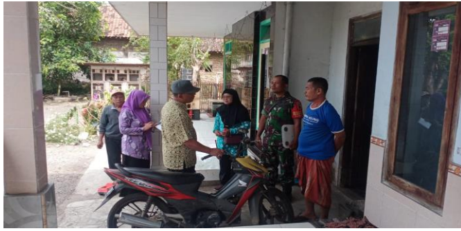
Monitoring Posyandi Di Desa Banyuputih Kidul