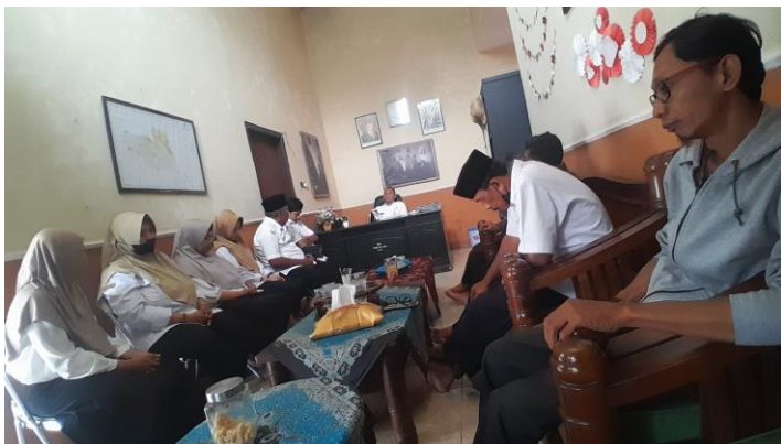
Rapat Staf Kecamatan Jatiroto