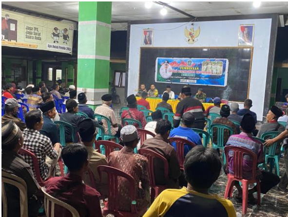
Pembinaan Satgas dan Linmas di Desa Kalibot Lor