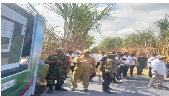
Menghadiri Kegiatan Petik Tebu / Manten Tebu di PG Djatiroto