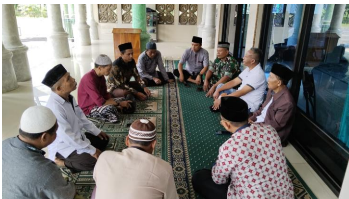
Koordinasikepala KUA, p.camat ,Polsek,Koramil, Desa Sukosari dan takmir Masjid Babussalam Terkait penempatan rest area arus mudik lebaran 2025 di masjid babussalam desa Sukosari kec Jatiroto