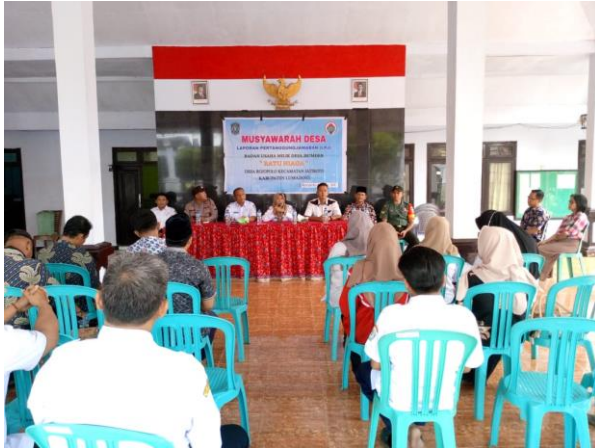
Musdes laporan pertanggungjawaban keuangan BUMDES desa rojopolo TA.2024