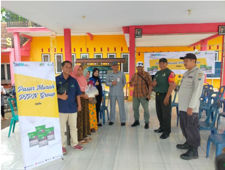
Kegiatan pasar murah gula PTPN Group di Balai Desa Jatiroto