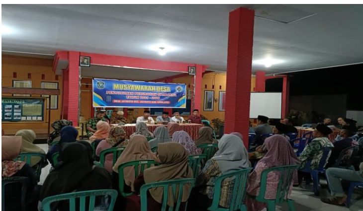
Musyawarah Desa Perubahan RPJMDes Desa Jatiroto