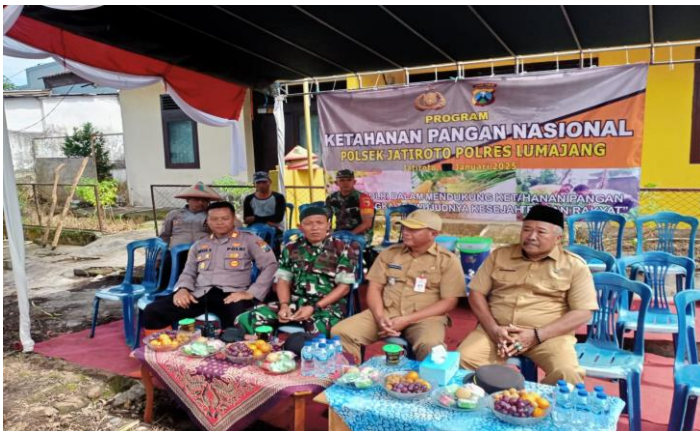
Menghadiri Penanaman Jagung Di Polsek Jatiroto Dalam Rangka Ketahanan Pangan Nasional