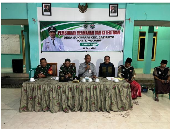
Pembinaan Satgas dan Linmas Di Desa Sukosari