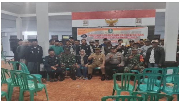
Pembinaan Satgas dan Linmas di Desa Rojopolo