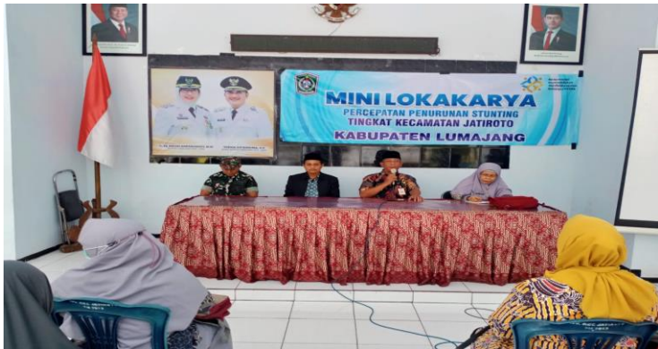
MINI LOKA KARYA Percepatan Penurunan Stunting Tingkat Kecamatan Jatiroto...