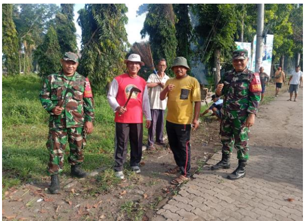
Kerja bakti bersama Masyarakat Jatiroto