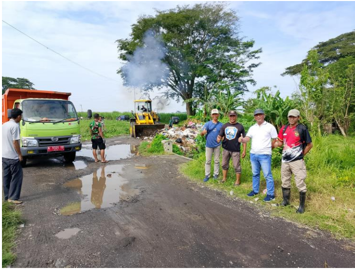
Camat Jatiroto beserta pihak P.G. Djatiroto dg fasilitasi DLH Lumajang membersihkan tumpukan sampah di sekitar wilayah Kecamatan Jatiroto