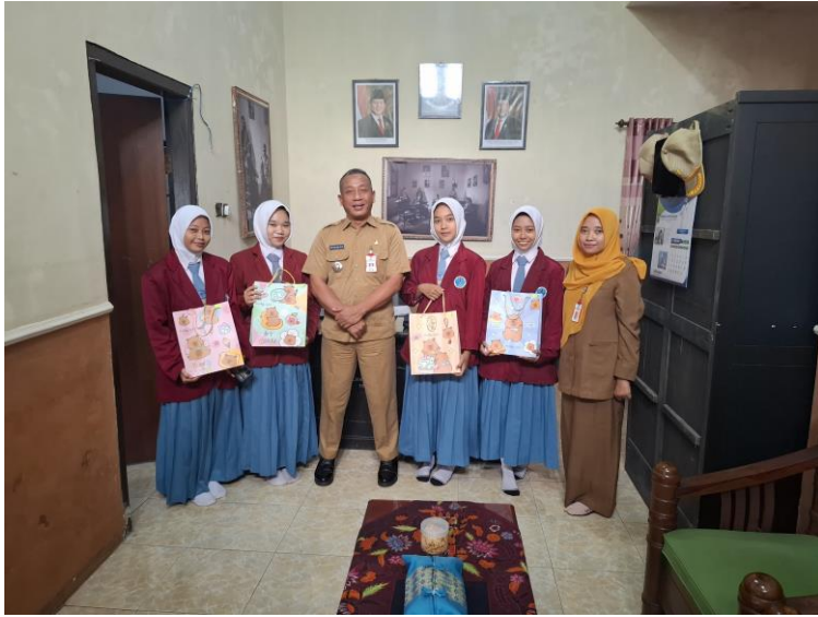
Pisah Kenang Siswa PKI Smk 6 Jember.