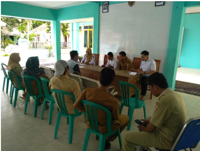
Monitoring Hasil DD di Desa Sukosari