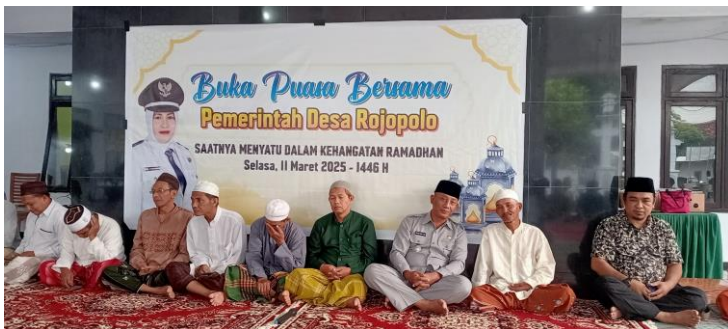
Buka puasa bersama 1446 H 2025 pemerintah desa rojopolo