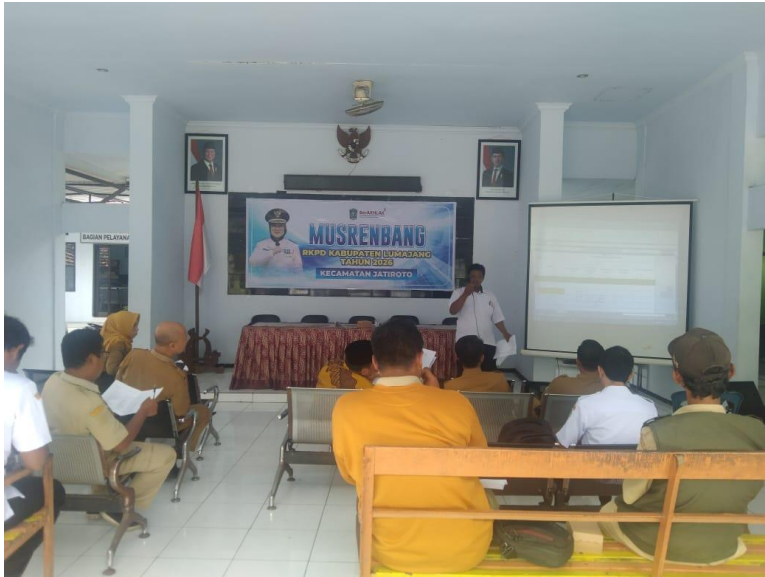
Musrenbang Tingkat Kecamatan